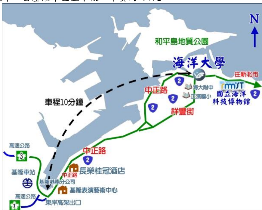
【基隆市區至本校簡要路線圖】