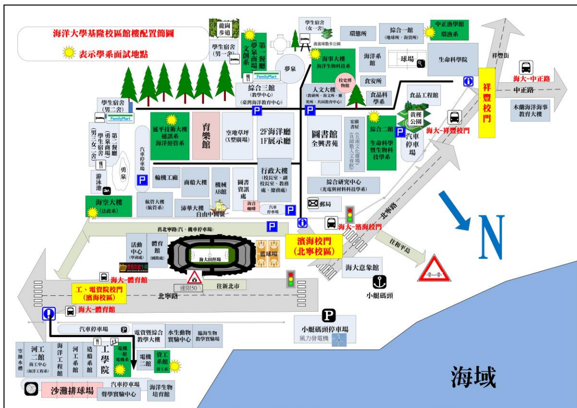
【本校館樓配置簡圖】