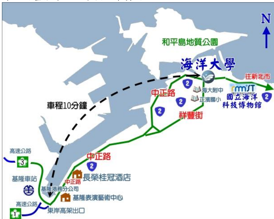
【基隆市區至本校簡要路線圖】