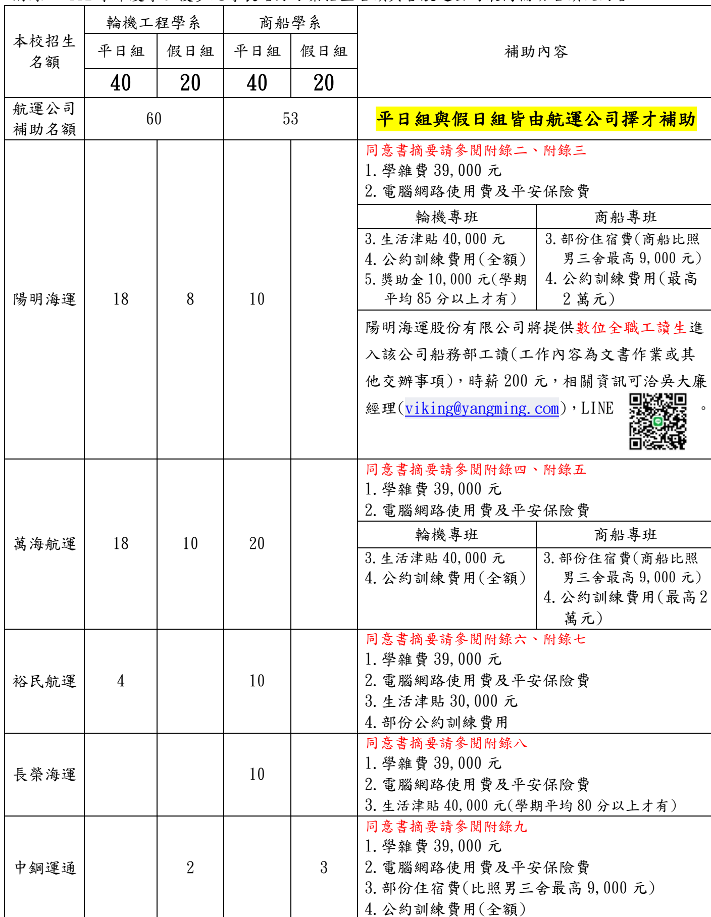
附錄一 112 學年度學士後多元專長培力方案招生名額與各航運公司最高補助名額及內容