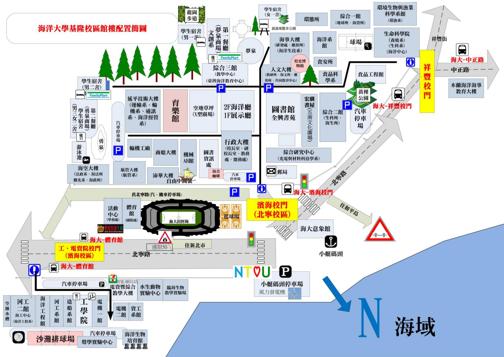
海洋大學基隆校區館樓配置簡圖